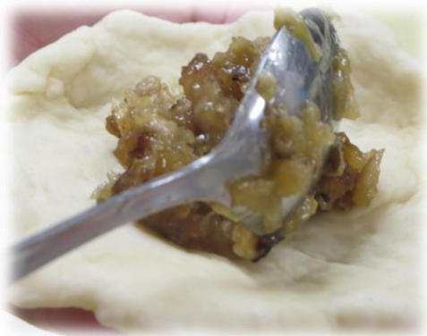
↑発酵させた後の生地にあんをのせて…

寒い冬と言えば、あったか〜い「肉まん」!! 保育所で作る肉まんは、タネからつくる本格的なもの。給食の先生が一つ一つ愛情をこめて手作りします。そんな苦勞をわかっているのかいないのか…。おやつを見た瞬間の子どもたちの歓声と笑顔が先生たちの元気の源ですね *^v^*